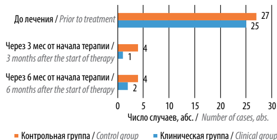
Рис. 1. Сравнение динамики частоты болевого синдрома у пациентов клинической и контрольной групп

Показатели общего анализа мочи нормализовались у 25 (83,3 %) пациентов клинической группы