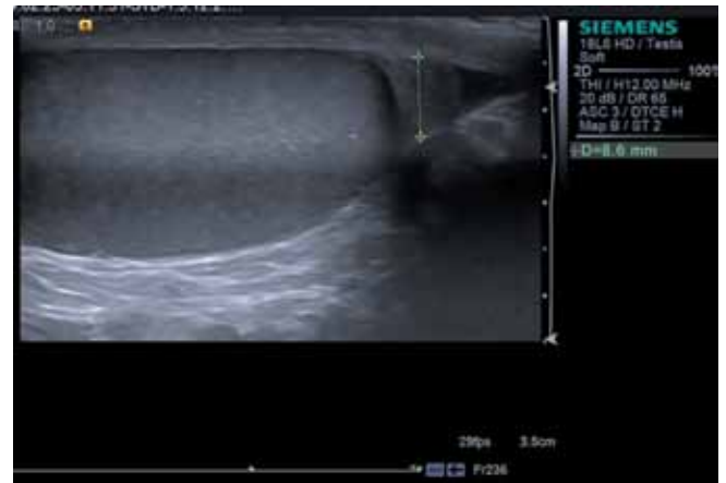
Рис. 3. Нормальный придаток яичка

В ходе обследования соноэластография яичек и придатка была выполнена у всех мужчин и была этапом ультразвукового комплексного исследования органов мошонки. Снижение эластичности ткани и наличие очагов повышенной плотности придатка яичка были выявлены у 34 пациентов (14 больных 1-й группы и 20 больных 2-й группы), участки сниженной эхогенности неоднородной структуры обнаружены у 12 пациентов 2-й группы. В режиме энергетического и цветового доплеровского картирования в данных зонах отмечалось обеднение сосудистого рисунка и снижение индекса перфузии. В 3-й группе подобных изме-