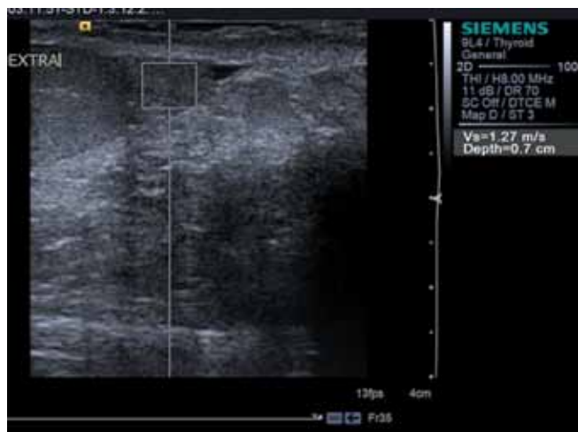
Рис. 5. Скорость поперечной волны придатка яичка в норме

щадь картирования «мягкой» ткани придатка яичка при соноэластографии придатка яичка, тем выше концентрация сперматозоидов, их быстрое поступательное движение (рис. 6).