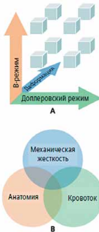
Рис. 1. Данные по механической жесткости ткани можно объединить с анатомическими данными (В-режим) и сведениями о кровотоке (доплеровский режим) (А), в результате чего фактический диагноз устанавливается по данным, лежащим на пересечении трех объемов информации (В).

В отличие от традиционных ультразвуковых исследований в В-режиме, при которых визуализация анатомических структур происходит на основе акустического импеданса, технология ARFI описывает относительные физические свойства тканей (жесткость/эластичность). В этом смысле технология визуализации Virtual Touch Tissue Imaging больше напоми-