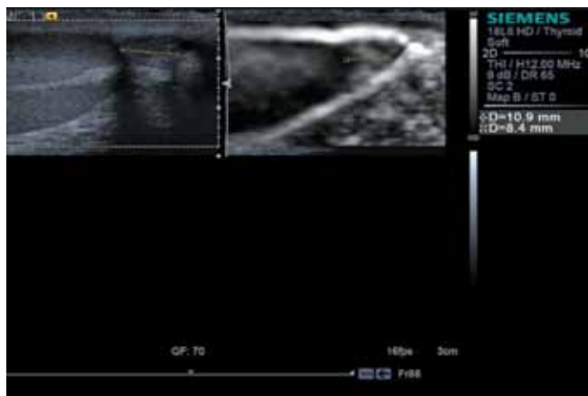
Рис. 2. QF придатка яичка

нений не найдено. В норме головка придатка яичка представлена более эхогенным, чем яичко, образованием (рис. 3).